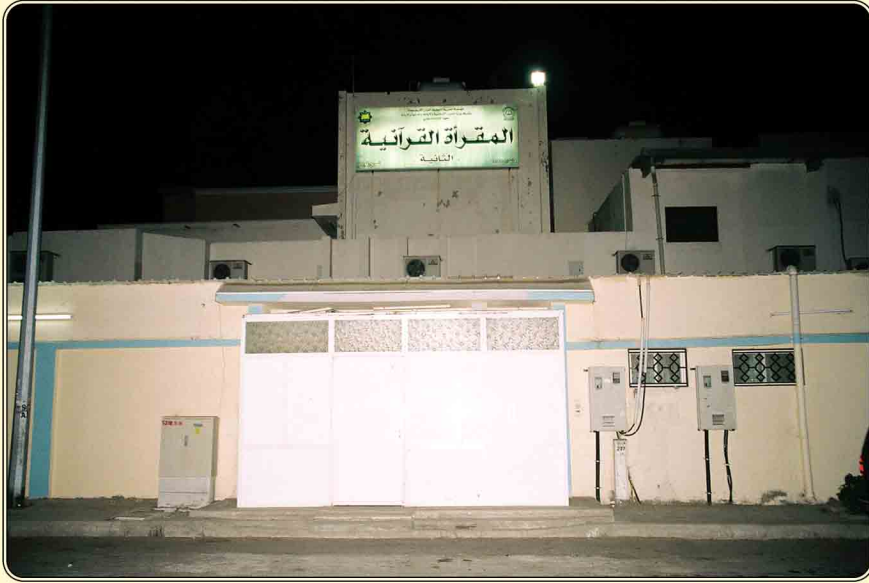
مبنى المقرأة من الجهة الأمامية